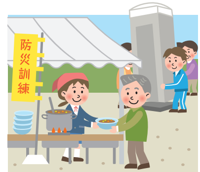
炊き出し・仮設トイレの設置