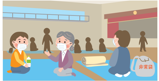
体育館での避難生活

港南区民が避難する場所は磯子区の1か所を含め32か所あり、 あらかじめ地域ごとに指定されています。