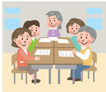
運営委員会の話し合い

また、実際に大地震が起きたことを想定し、毎年、秋を中心に地域防災拠点運営訓練を実施しています。