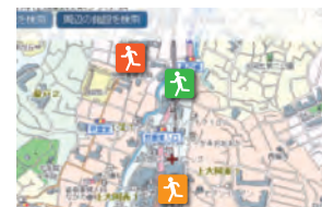
帰宅困難者一時滞在施設検索システム画面