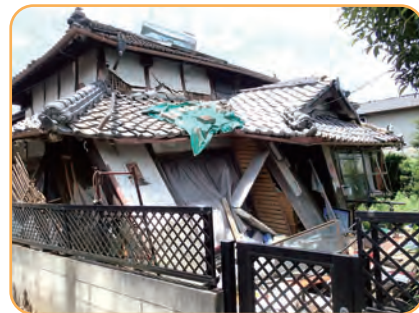
平成28年 熊本地震による被害(熊本県内)