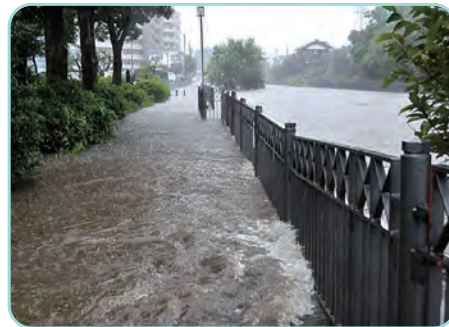
平成26年 いたち川の浸水被害(横浜市内)

また、台風や大雨は発生や規模が事前に把握することがある程度可能であり、被害を少しでも抑えるためにも正確な情報を把握し、事前の備えを十分行い、的確な避難行動をとることが大切です。